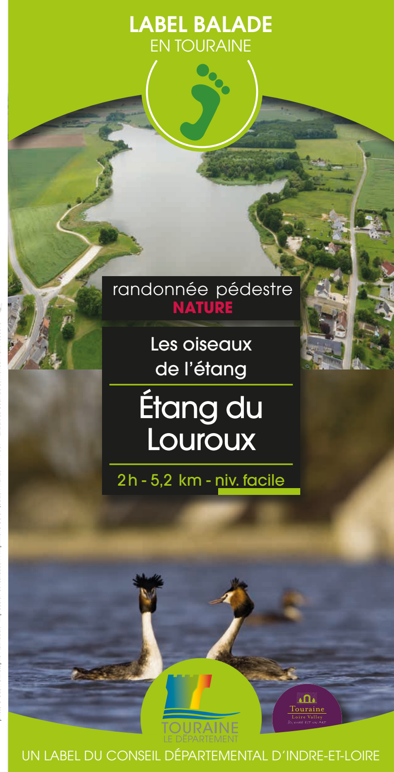
impression et réalisation - Impression Cd 37 - édition mai 2017 - n°637 - Extrait du Scan 25 convention IGN/4000970